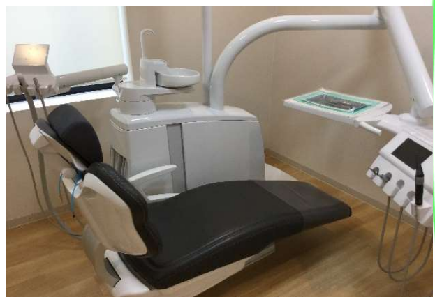
患者様から人気！1階のドイツ製のチェアー